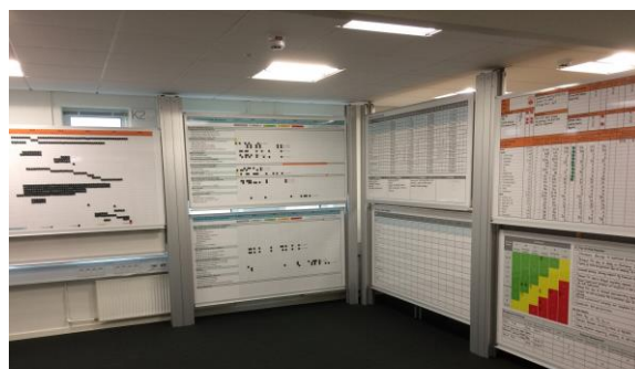
Samarbejdsrum for ledelsesteamet i et O+G megaprojekt til et tocifret DKK mia. beløb